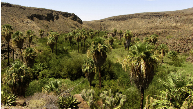
Figura 2. Vista del oasis San José en la ecorregión del Desierto Central de Baja California.

de agua superficial con pozas de manera permanente. El hábitat presenta una densa vegetación riparia en la que predominan la palma abanico ( Washingtonia robusta ), el sauce ( Salix lasiolepis ), la hierba del manso ( Anemopsis californica ), el guatamote ( Baccharis salicifolia ) y el junco ( Juncus acutus ) (fig. 2).