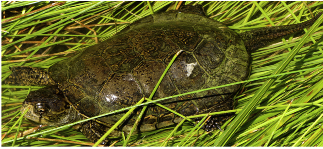
Figura 1. Ejemplar de Emys pallida del oasis San José, Baja California, México.