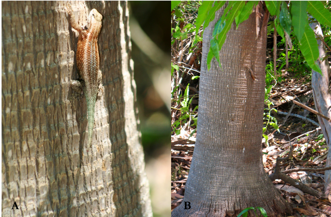
Figura 2. Sceloporus licki en tronco de palma entre cultivo de mangos en el Rancho La Trinidad, Sierra La Trinidad, Baja California Sur. A) acercamiento donde puede distinguirse la franja lateral clara distintiva de la especie, B) individuo en tronco de palma dentro de cultivo de mango.

enseguida: Rancho La Trinidad (23.38455°N, 109.559539°W, elevación 315 m), se colectaron dos ejemplares: un macho (CIB 813) y un juvenil (CIB 814) y se observaron 13 animales más. Los individuos fueron observados en troncos de palma y mangos en áreas de cultivo, donde no había rocas cercanas (Fig. 2). En el Rancho Lengua de Buey (23.3400806°N, 109.566261°W, elevación